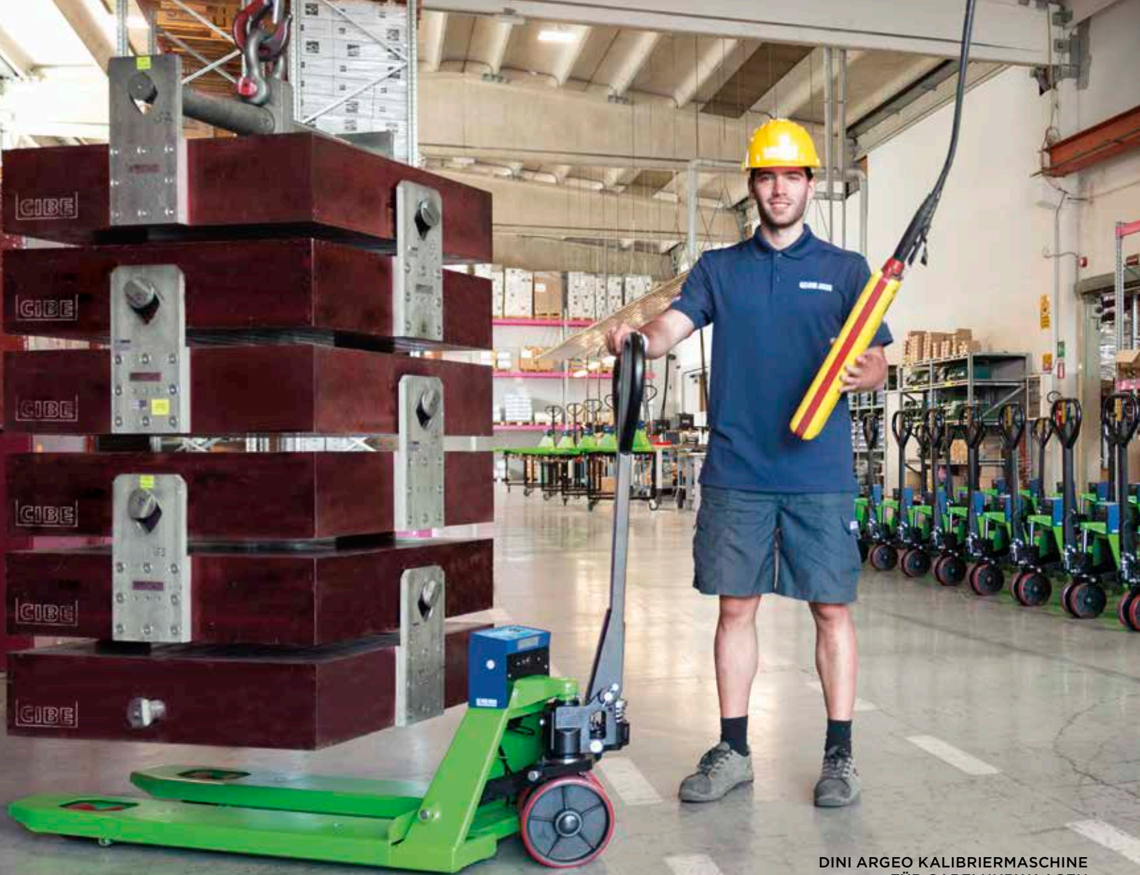
DINI ARGO KALIBRIERMASCHINE FÜR GABELHUBWAAGEN